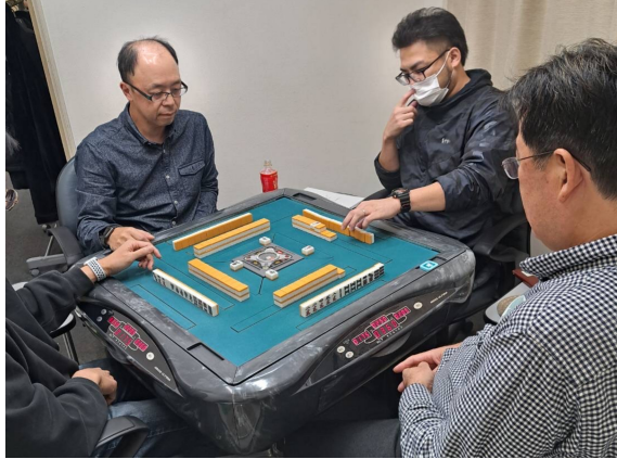
最善の一手を模索する雀士一同

11月18日(土) 17:30より約20年ぶりに麻雀大会が開催されました。親睦ボーリング大会の後企画されたことや、第76回道南医学会が